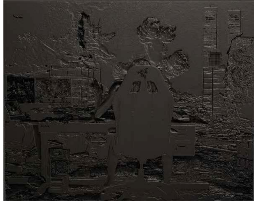
Adrián Gil Engranaje de metal sólido 2024