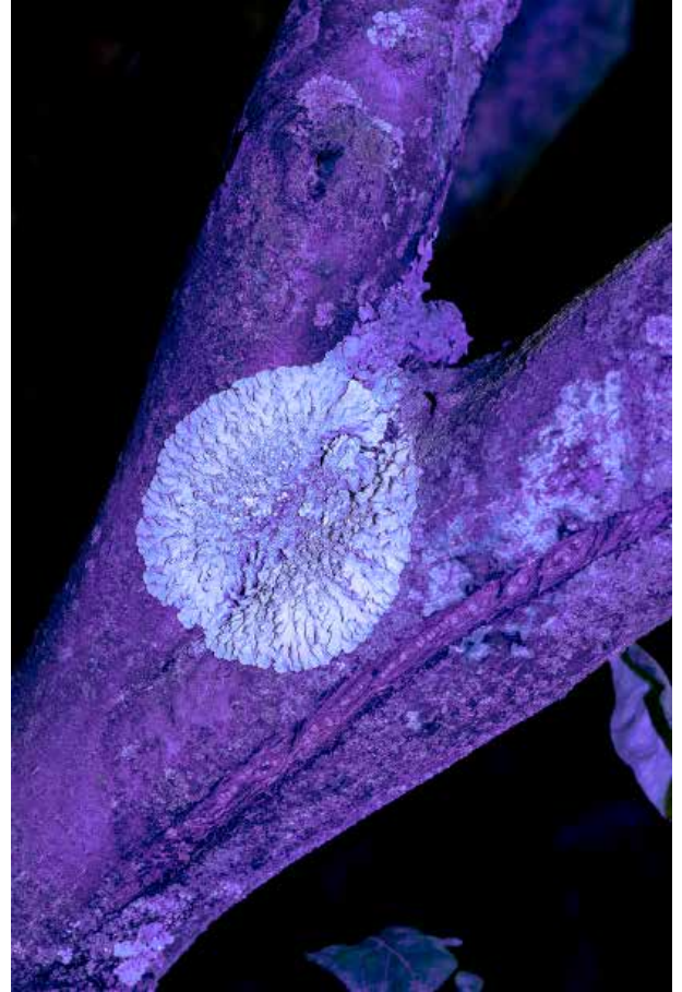
Alejandra Edwards Imágenes para preguntas sin respuesta 2024