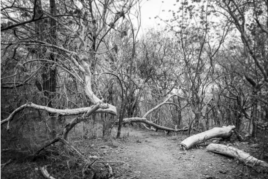
Carmen Torres Estar en el cerro 2024