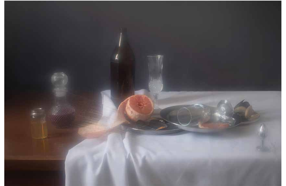
Antonio Barrientos Formas indetectables 2024