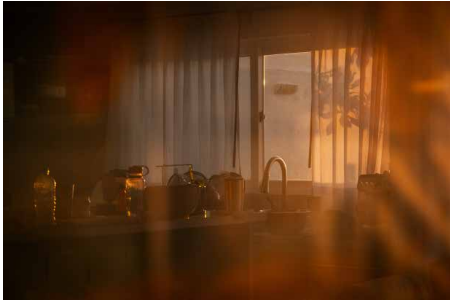
Carolina Fuentes Cartografías para no perderse IV 2024