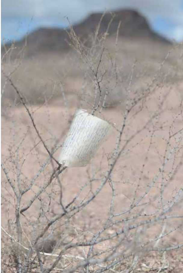
Inés Cazares El venado, la casa y el óvalo 2024