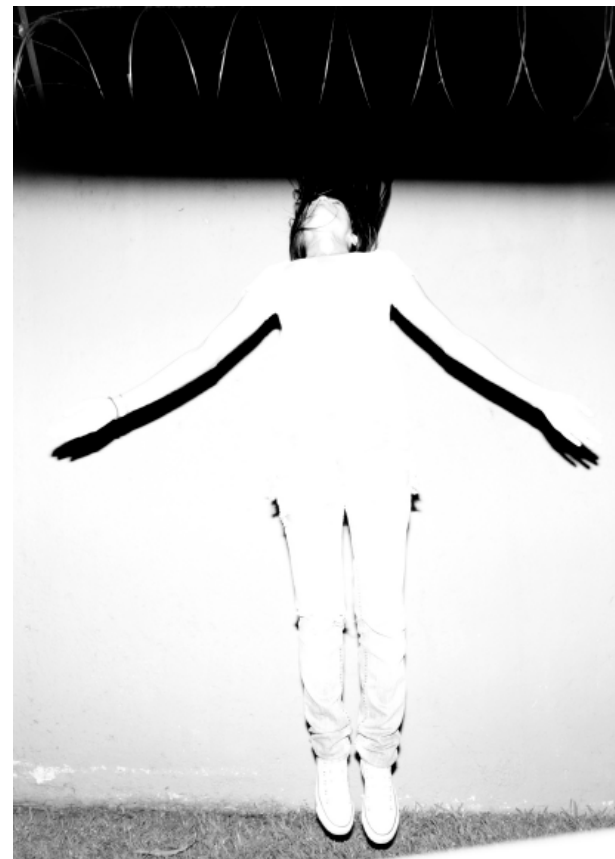
Rodrigo Dada Luz oculta 2024