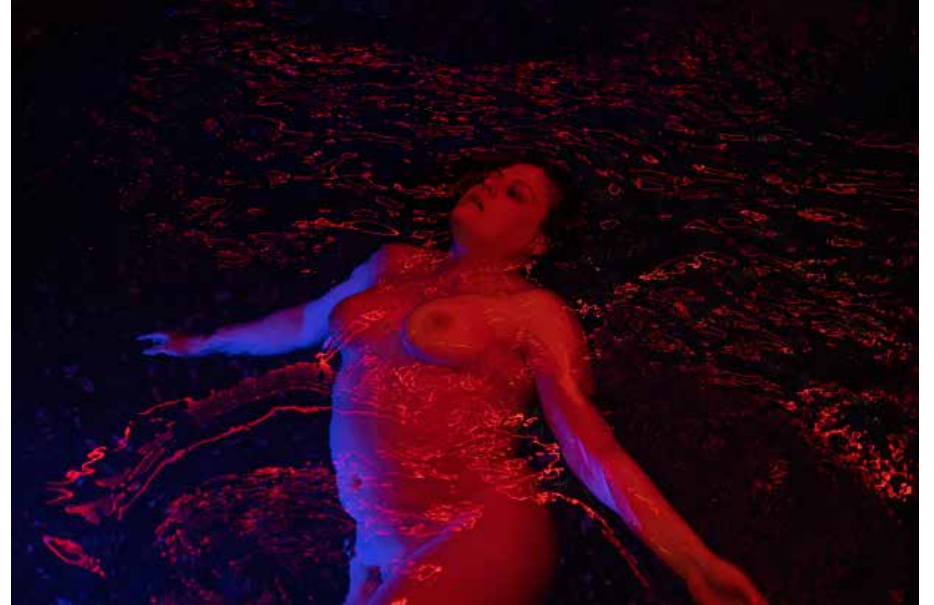
Santy Mito Proyecto cualquiera 2024