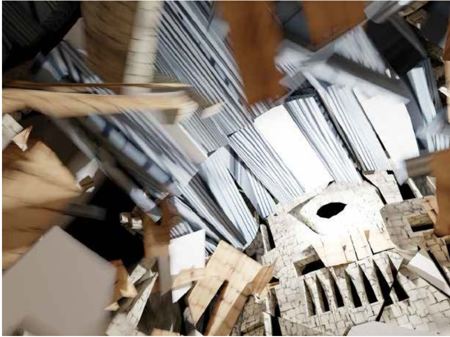
mau suárez nombres_de_tiemras 2024