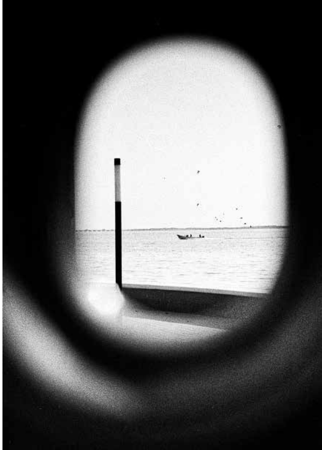
Darío Campos Cervera Carmen 2024