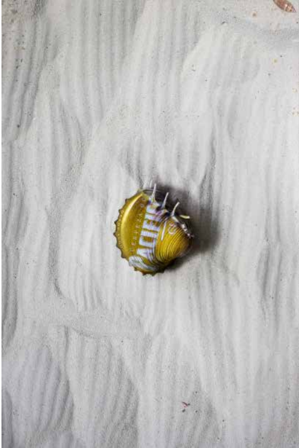
Coraima Mena Océanoceno 2024