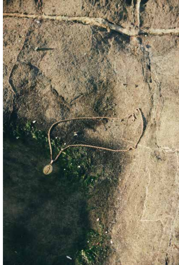
celesté hernández Cuídate mucho pues te necesitamos 2024