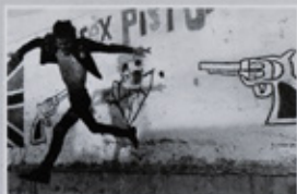
PABLO ORTIZ MONASTERIO

56 x 78 cm / impreso a tres tintas / papel couché de 200 kg