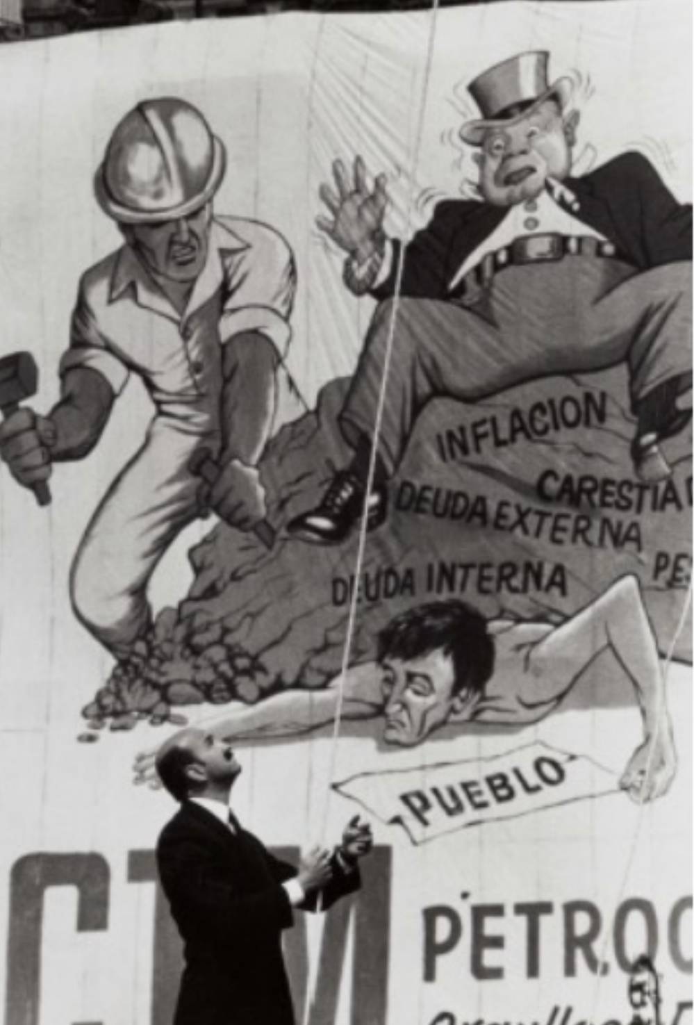
Carlos Salinas de Gortari, presidente de México (1988-1994), en la conmemoración del 1° de mayo de 1989 en la Ciudad de México.