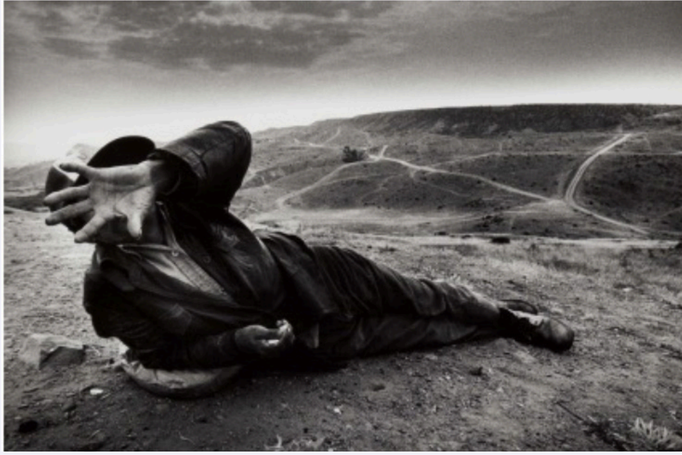
ELSA MEDINA. El migrante . Cañón Zapata, Tijuana, Baja California, febrero de 1987. Fondo Exposiciones, Centro de la Imagen FRANCISCO MATA ROSAS. Mictlán . Ciudad de México, 1989. Fondo Exposiciones, Centro de la Imagen JOSÉ HERNÁNDEZ-CLAIRE. Las manos amigas . Guadalajara, Jalisco, 22 de abril de 1992. Fondo Exposiciones, Centro de la Imagen