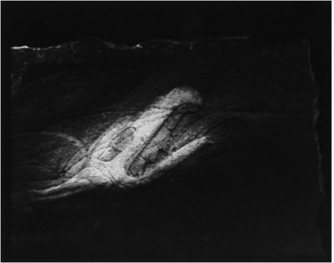
GERARDO SUTER. Animal de Chalcotzingo , 1985. Fondo Consejo Mexicano de Fotografía